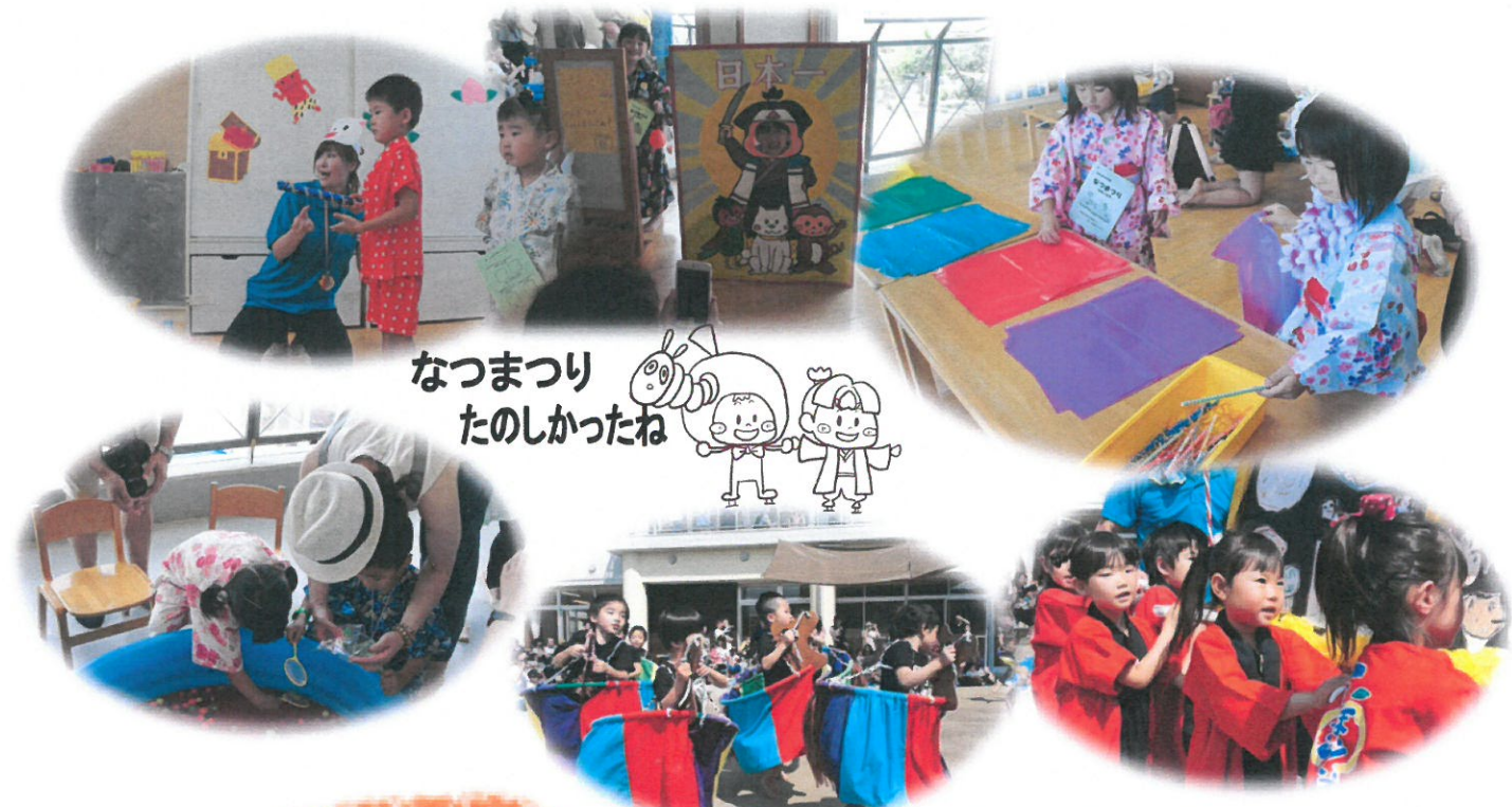
なつまつり たのしかったね

さて、暑い夏の水遊びはプールだけでなく、園庭のすべり台を使って“ウォーターライダー”やおもちゃについた泥をタライで“お洗濯”です。年々どろんこ遊びもダイナミックになってきました。夏にしかできない遊びをいっぱいして、丈夫な体づくりをしていきます。